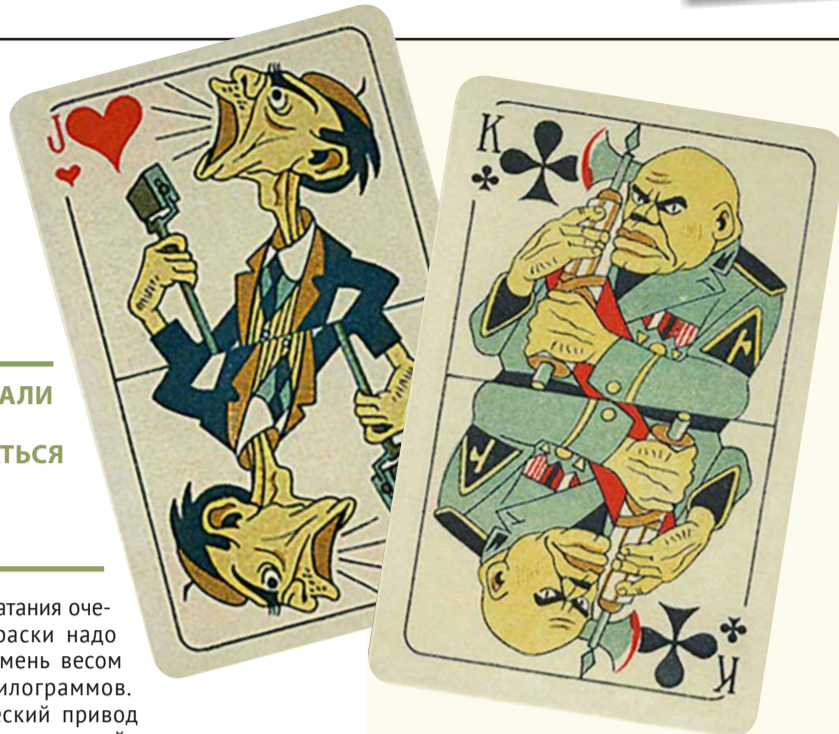
КОЛОДА ВЛАСОВА СОСТОЯЛА ИЗ 17 КАРТ С КАРИКАТУРНЫМ ИЗОБРАЖЕНИЕМ НАЦИСТСКИХ ЛИДЕРОВ И ИХ СПОДВИЖНИКОВ.